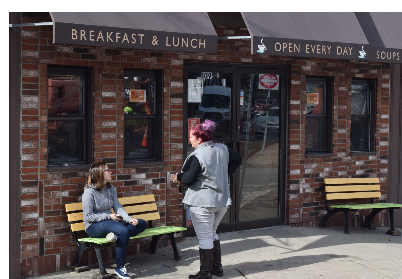
Hỗ trợ các doanh nghiệp địa phương.