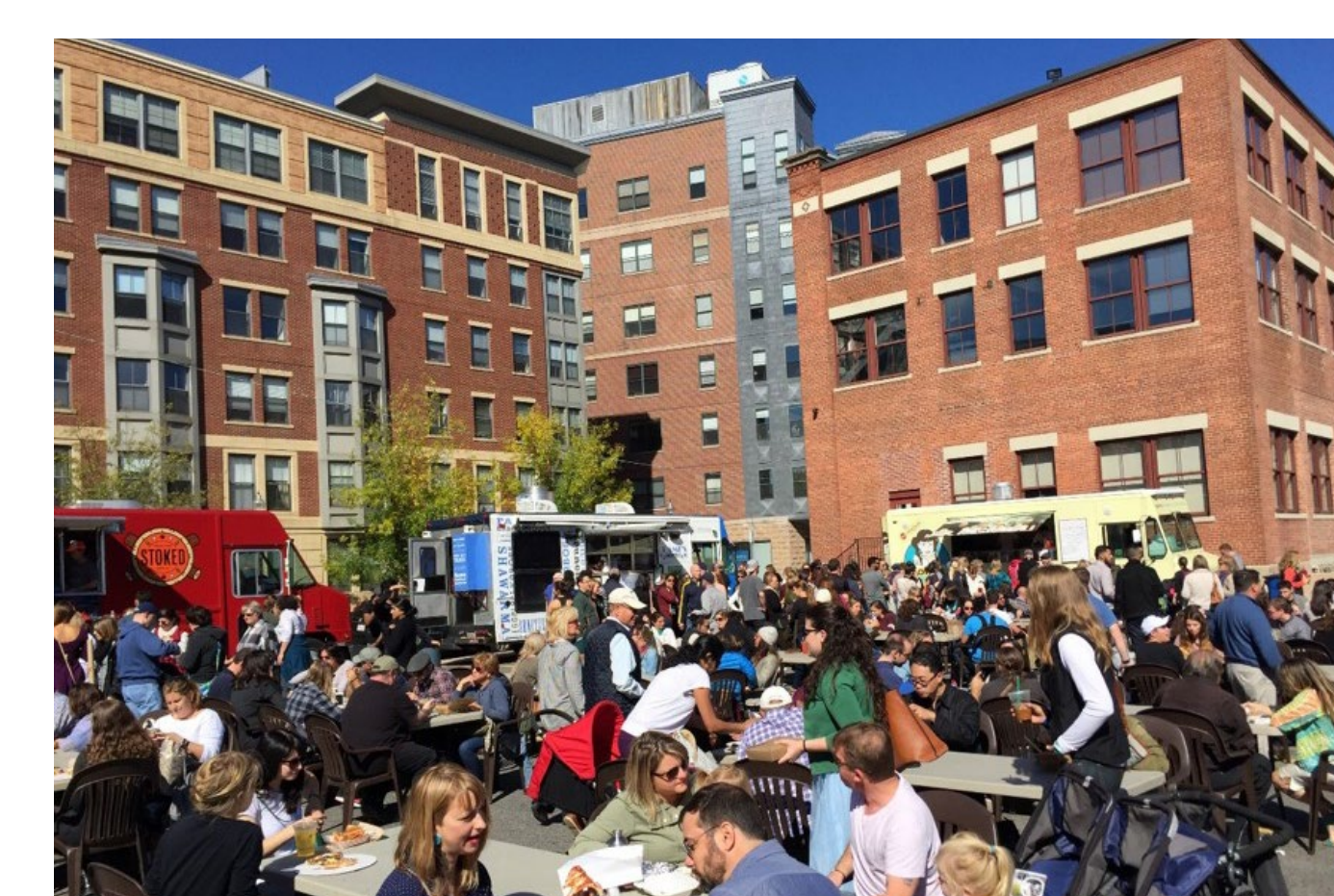
Thông qua quá trình phát triển, tạo ra một khu phố hướng đến con người