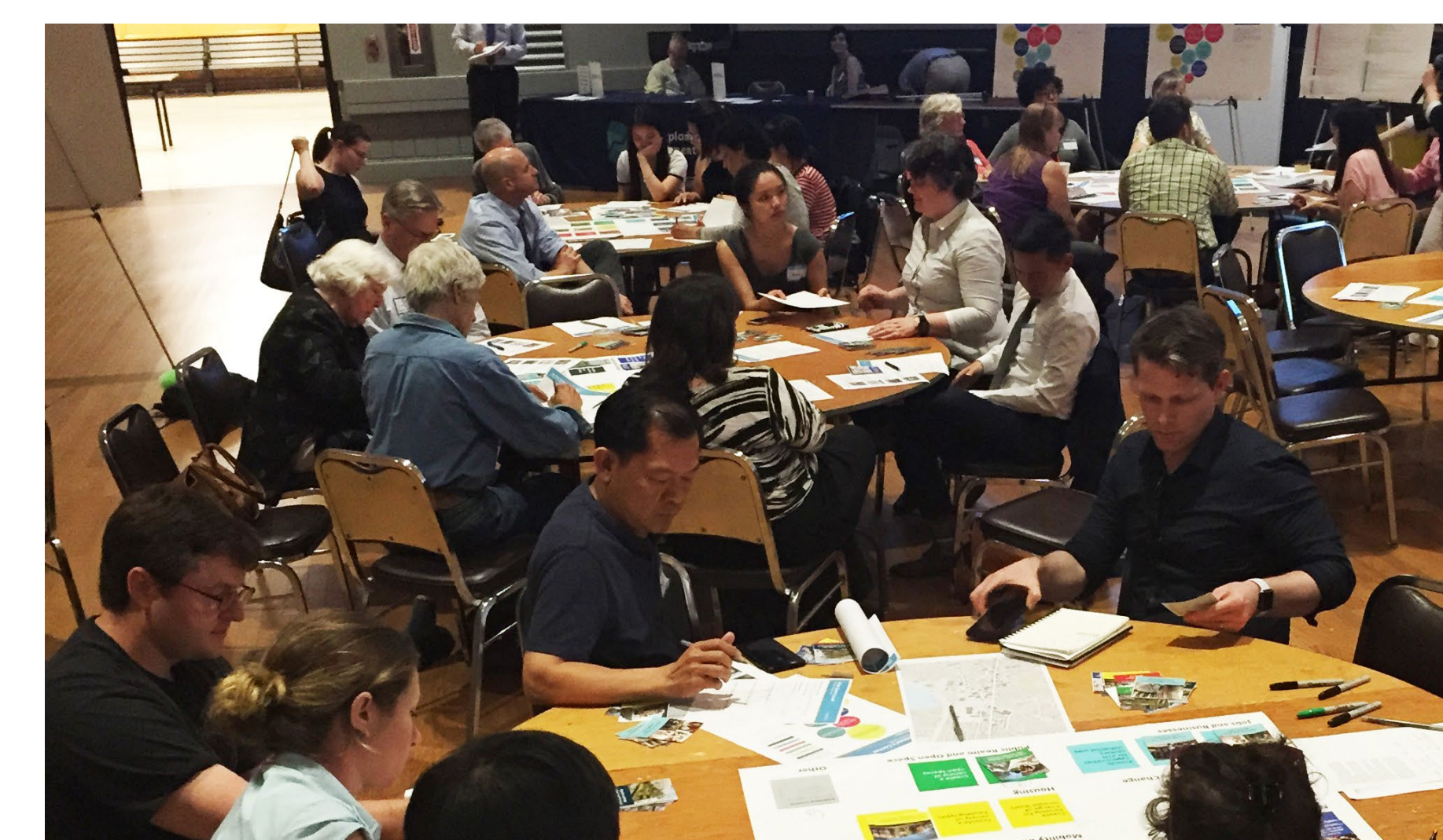
Các thành viên thảo luận về những ưu tiên trong buổi hội thảo