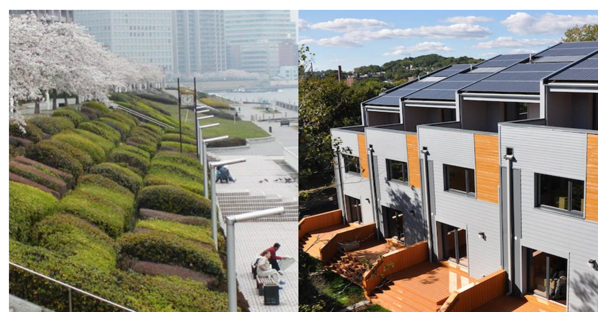
Lập kế hoạch để tạo ra một khu phố có sự chống chịu với khí hậu

Tất cả các nhóm đều nhận thấy rằng để thực hiện các ưu tiên khác thì việc tăng khả năng chống chịu với khí hậu nên là ưu tiên xuyên suốt qua các thời kỳ.