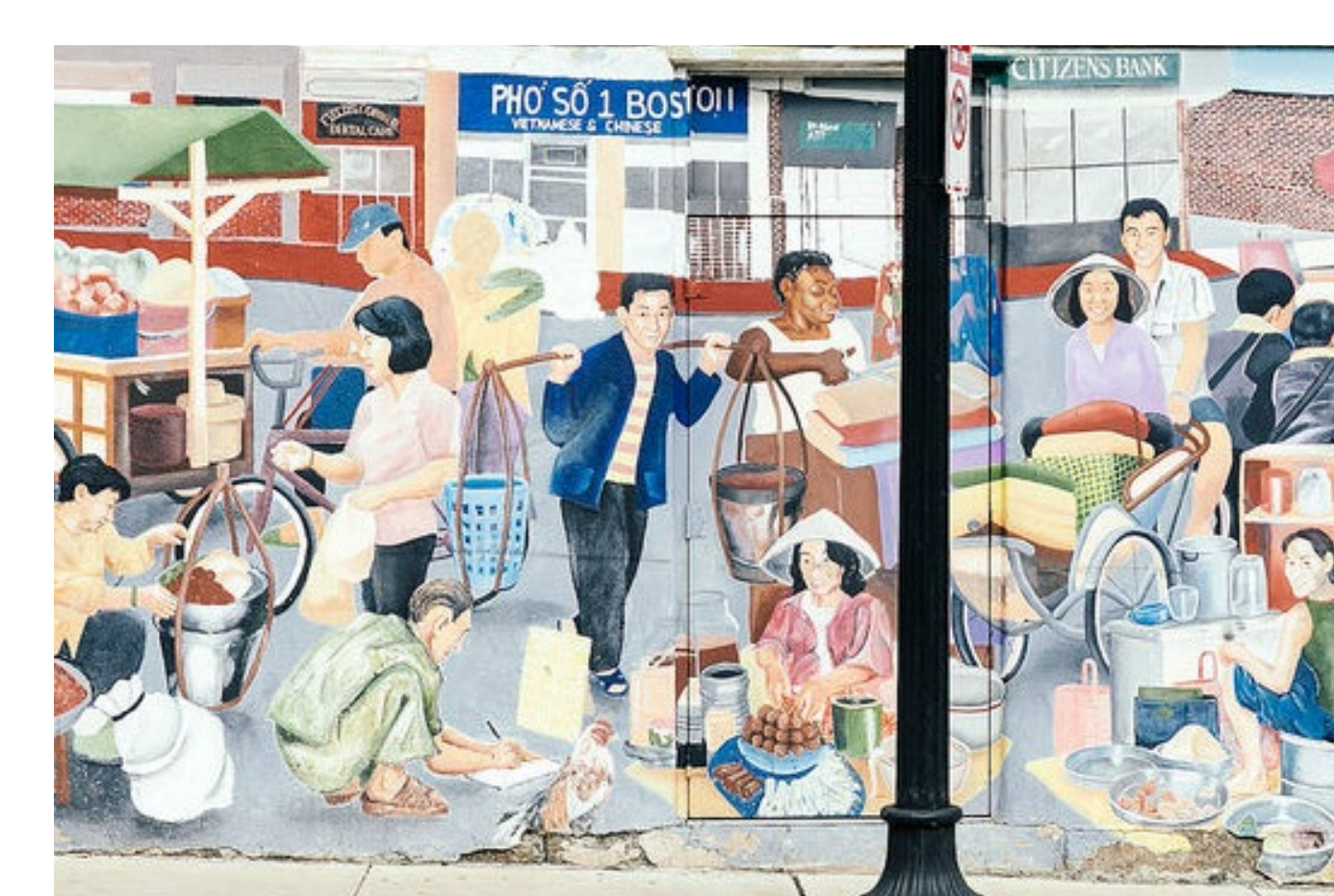
Hỗ trợ sự đa dạng văn hóa tại khu phố