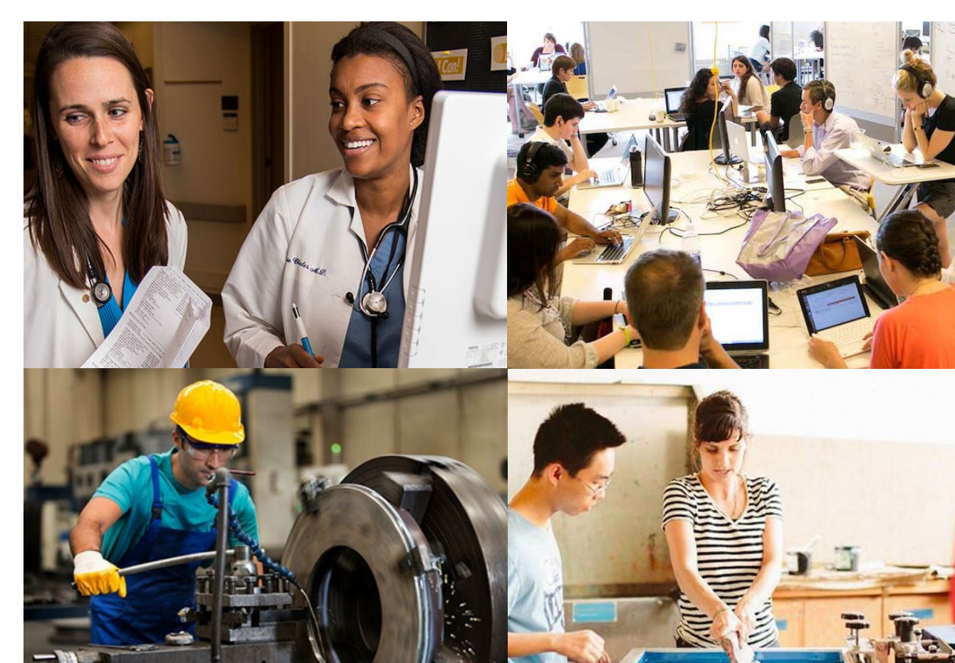
Duy trì và phát triển những công việc có chất lượng