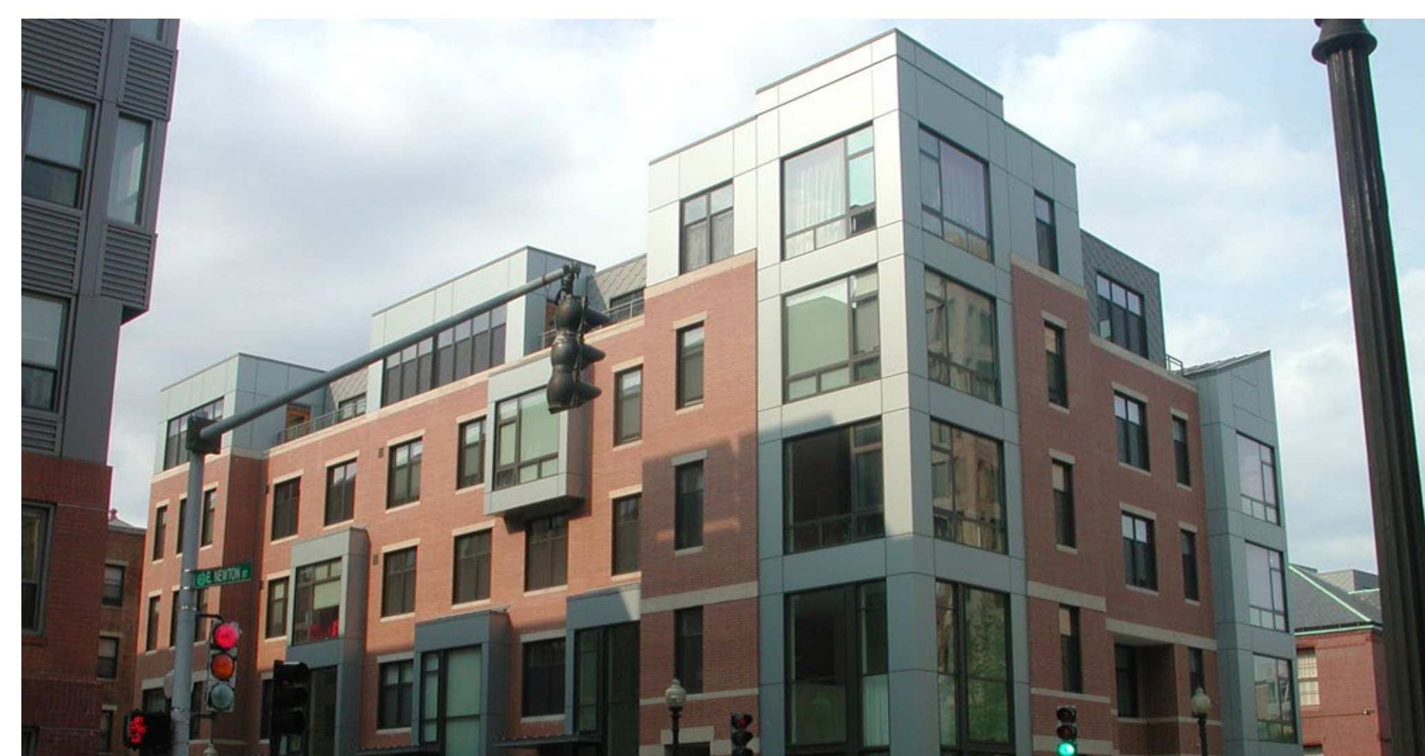
Nhà ở cho người dân ở mọi thu nhập

Nhà ở cho người dân ở nhiều mức thu nhập được xem là ưu tiên hàng đầu. Cuộc thảo luận tập trung vào tạo ra các loại nhà thu nhập thấp kèm theo các loại nhà theo giá thị trường. Một yếu tố quan trọng là phải duy trì sự phải chăng và ổn định về giá nhà cho người dân.