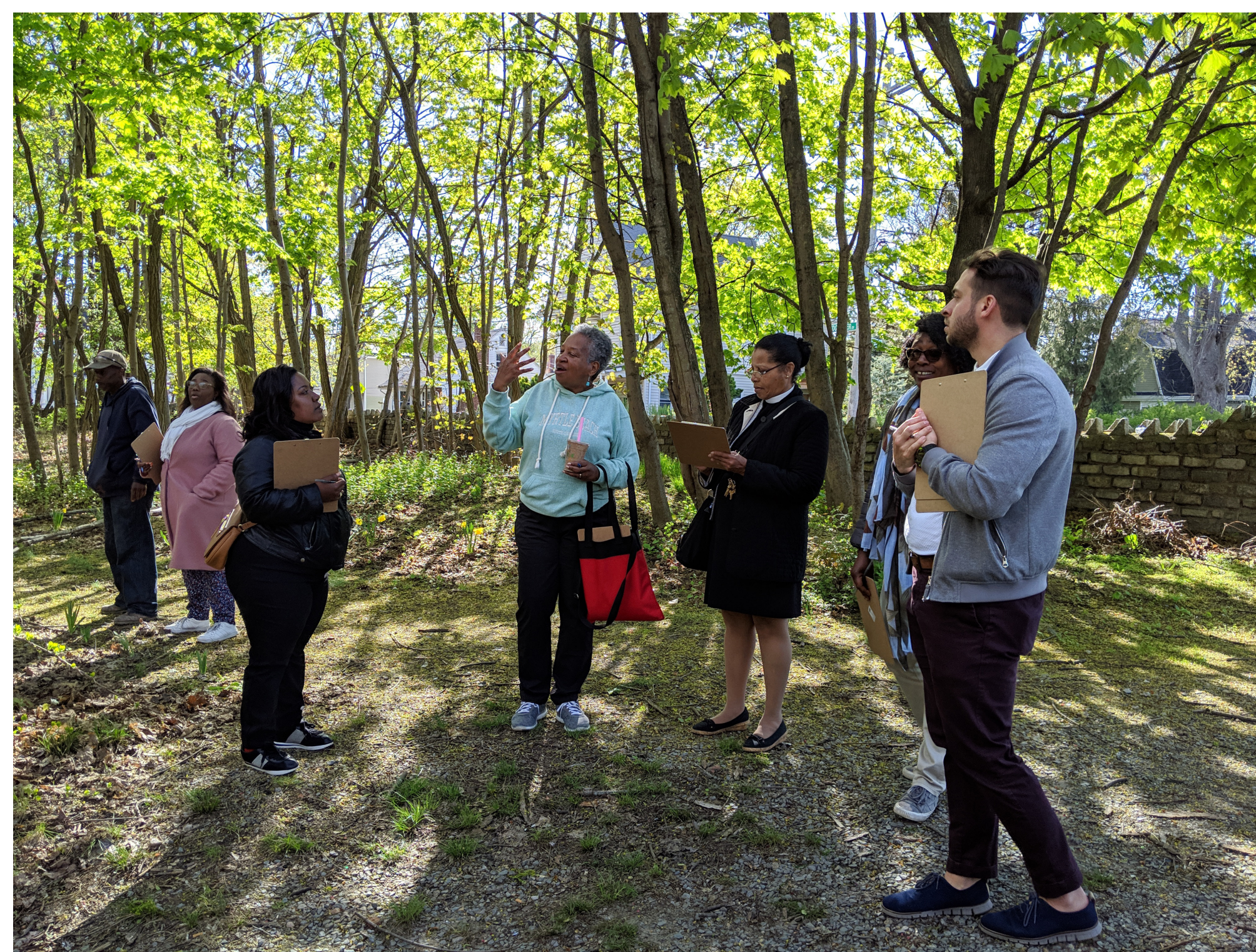
PLAN: Mattapan se yon inisyativ planifikasyon kominotè.