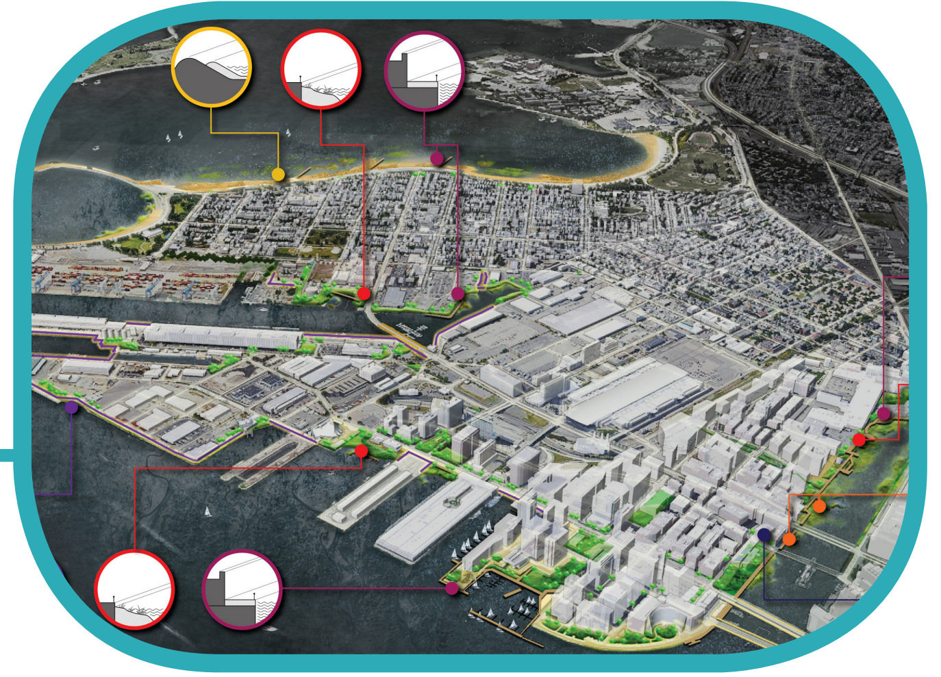
Neighborhood Scale: Resilient Waterfront Park Escala de vecindario: Parque resiliente en la costanera