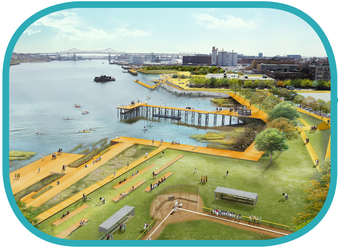
Neighborhood Scale: Vegetated Berm Escala de vecindario: Arcén con vegetación