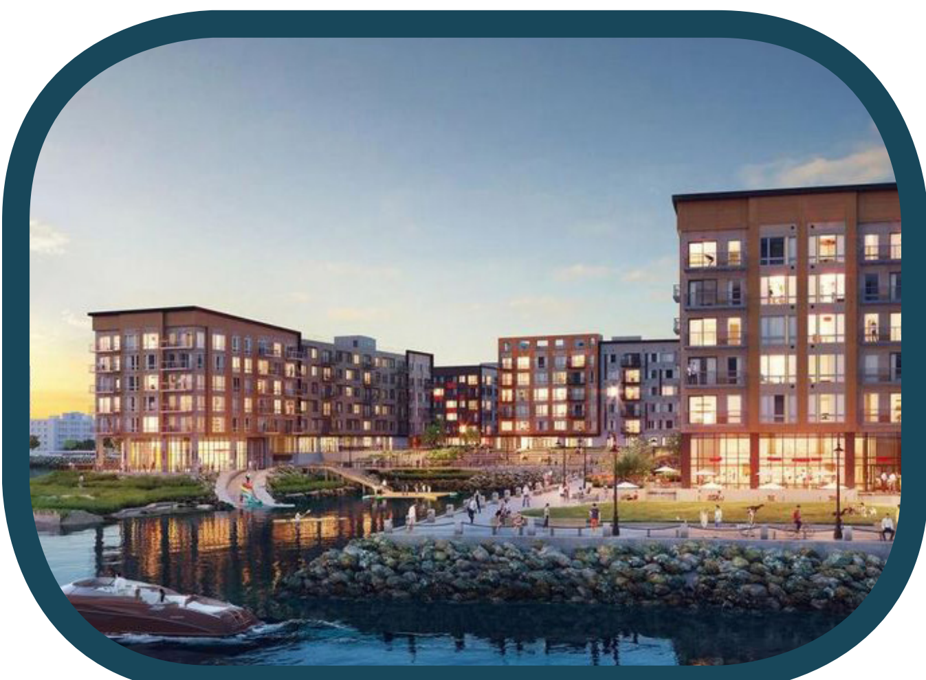
Site Scale: Living Shoreline and Buffer Clippership Wharf, East Boston Escala del sitio: Living Shoreline y Buffer

↑ PUBLIC REALM ÁMBITO PÚBLICO ↓ PRIVATE REALM ÁMBITO PRIVADO