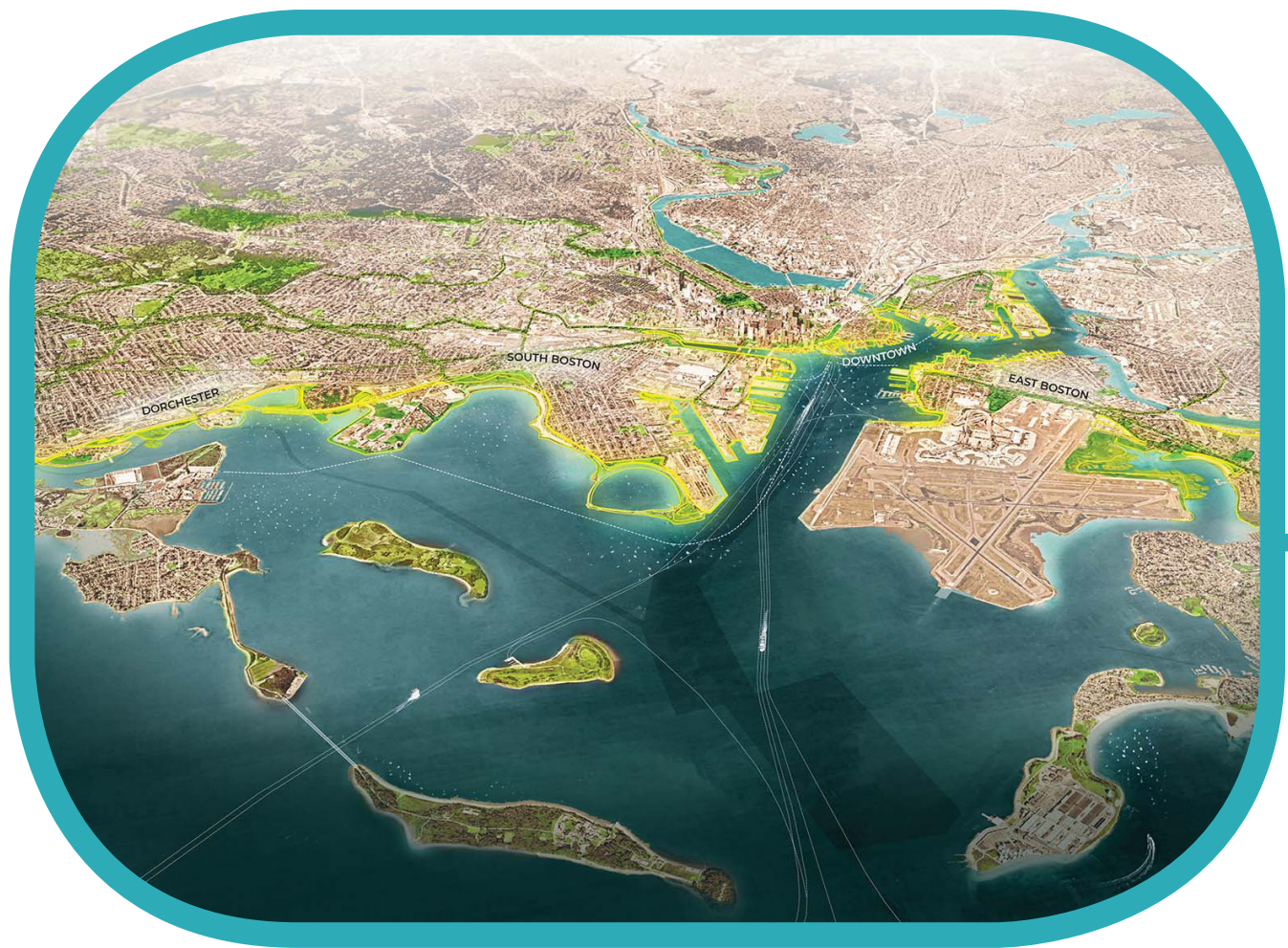
City Scale: Resilient Boston Harbor Escala municipal: Bahía de Boston resiliente

El Distrito de superposición de la zonificación de resiliencia contra inundaciones y las Directrices de resiliencia se basarán directamente en la iniciativa Climate Ready Boston (CRB por sus siglas en inglés) de la Municipalidad de Boston y sus recomendaciones. La misión de la iniciativa CRB es generar soluciones resilientes para vecindarios, infraestructura y gobierno que ayuden a la región a prosperar y crecer ante el desafío del cambio climático a largo plazo.