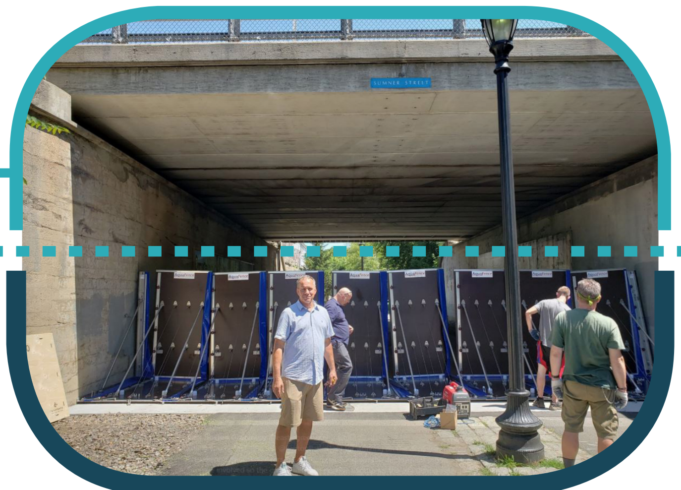
District Scale: Deployable Flood shields Escala del distrito: Protectores desplegados contra la inundación

↑ PUBLIC REALM ÁMBITO PÚBLICO ↓ PRIVATE REALM ÁMBITO PRIVADO