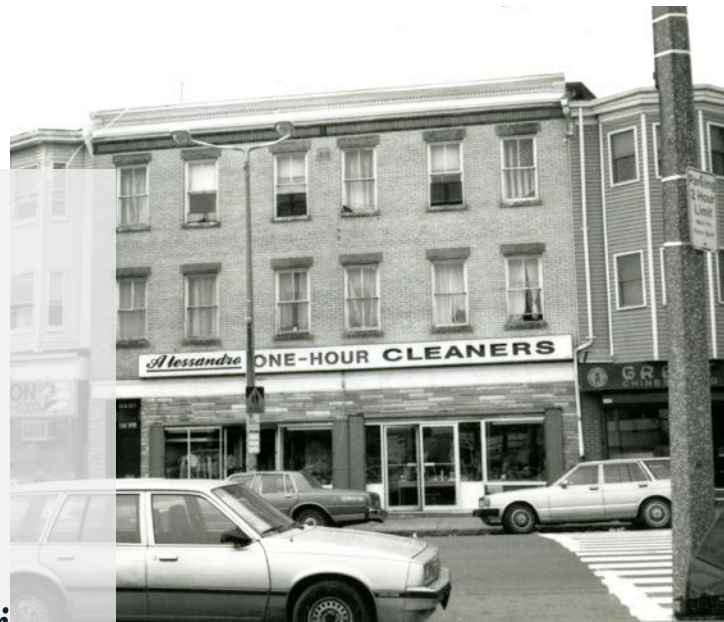
Boston in 1990s

Yo te etabli kondisyon pou egzamen ki mansyone nan Atik 80 an depi prèske 30 lane. Depi lè sa a, planifikasyon ak devlopman nan Boston te chanje anpil. Volim ak kompleksite pwojè devlopman yo ogmante. Inisyativ politik ak efò planifikasyon ki gen rapò ak anviwònman bati a evolye pi rapid pase kòd zonaj la li menm epi yo te ajoute kòm anèks nan pwosesis la san yo pa entegre yo nan zonaj la. Pwosedi ak operasyon egzamen pwojè devlopman yo te toujou ap adapte pou reponn ak defi sa yo, ki te bay yon pwosesis ki sanble la pou yon sèl rezon, ki inaksesib, epi ki enprevizib pou tout aktè yo.